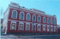
ДДТ Приморского района, СПб