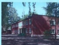
ГОУ ДО ЯО ДДИОТурЭЖ, Ярославль