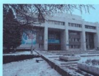
ГБОУ «ДДЮТ», Архангельск

Методический центр Тел/факс 8(8182)21-18-09 e-mail: metod@pionerov.ru